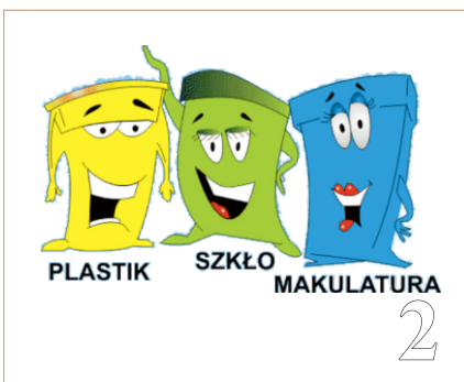
Uchwała intencyjna Rady Gminy