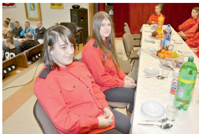
Młodzieżówka z OSP Liniewo