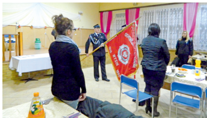
Uroczyste otwarcie zebrania w OSP Wysin