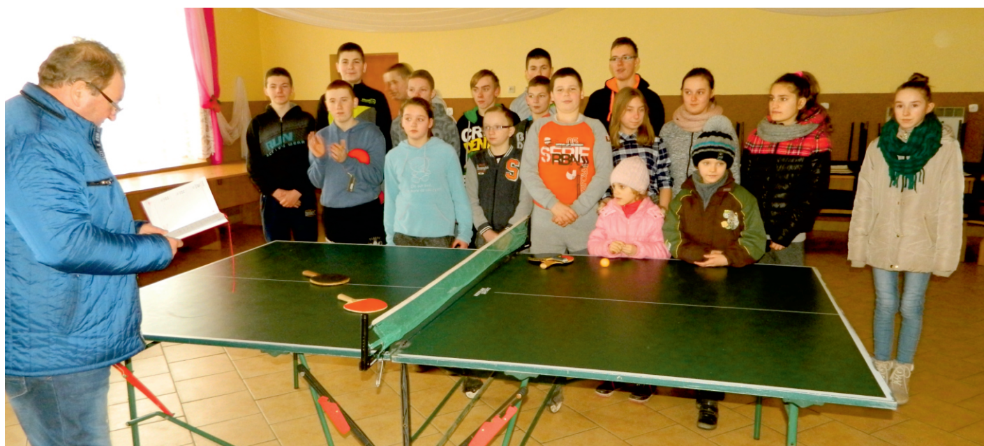
Turniej tenisa w Wysinie