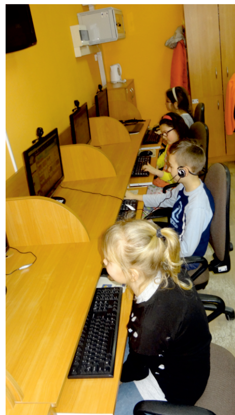
CK zawsze jest czynne