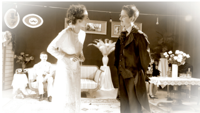
Młodzi aktorzy z liniewskiego gimnazjum na scenie

Bez wątplenia spektakle uczniów gimnazjum Publicznego w Liniewie, których oczekują wszyscy z dużą niecierpliwością, na stałe wpisują się do kalendarza imprez artystycznych w Gminie Liniewo.