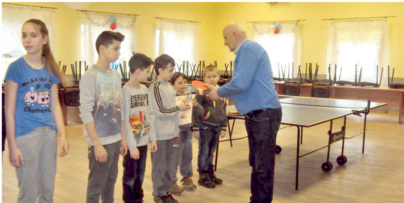
nagrody dla zwycięzców