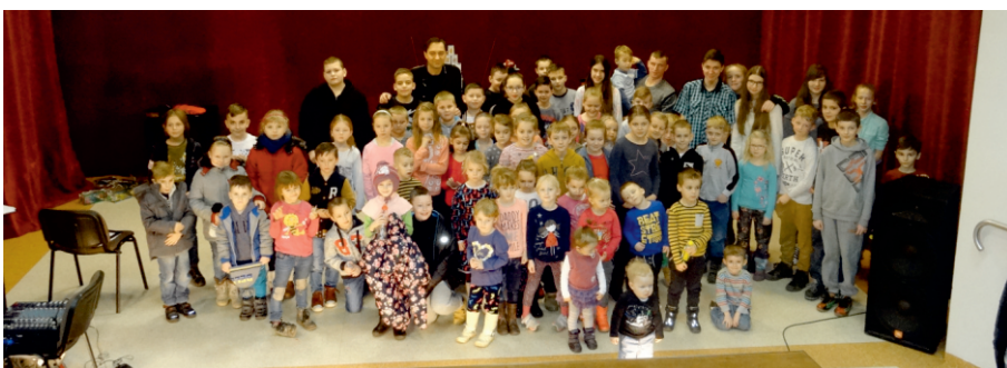
Abrakadabra spotkanie z iluzjonistą