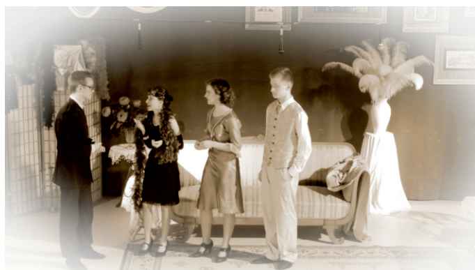
W trakcie spektaklu