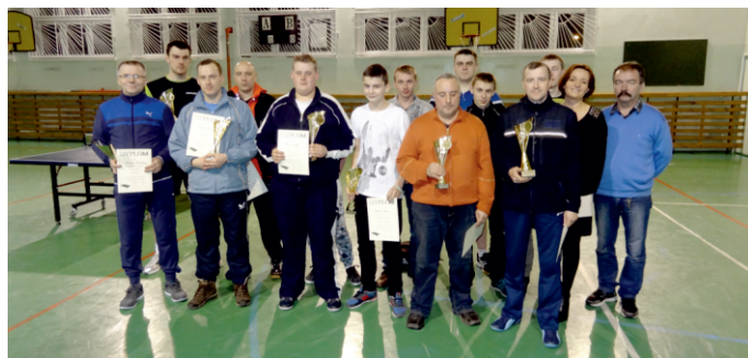
Turniej Tenisa dla dorosłych