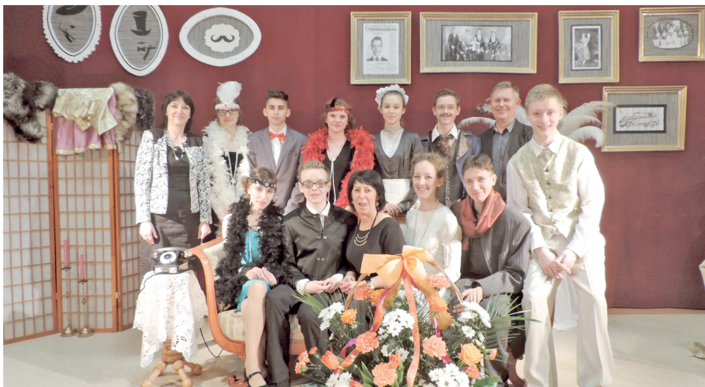
Nasi aktorzy z opiekunami