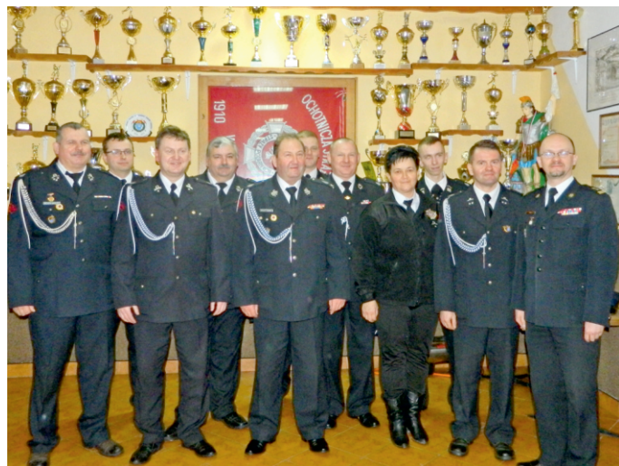
Wybory nowych władz OSP Wysin

Należy nadmienić, że poza działalnością stricte strażacką, druhowie z naszych Jednostek OSP aktywnie działali na rzecz lokalnej społeczności. Włączali się między innymi w organizację festynów, ferii, czy uczestniczyli w akcji sprzątania świata, a także propagowali wśród najmłodszych zasady bezpieczeństwa i ideę ochotniczej straży pożarnej. Właśnie za ten rodzaj działalności, jak i niesienie pomocy drugiemu człowiekowi, słów uznania w kierunku druhow nie szczędzili zgromadzeni goście na wszystkich spotkaniach w Jednostkach OSP.