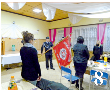
Wybory w jednostkach OSP