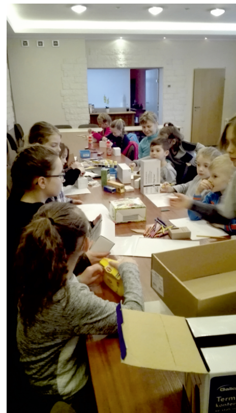
Budowa wesołej Wsi