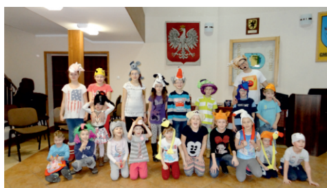
Nie ma czasu na nudę