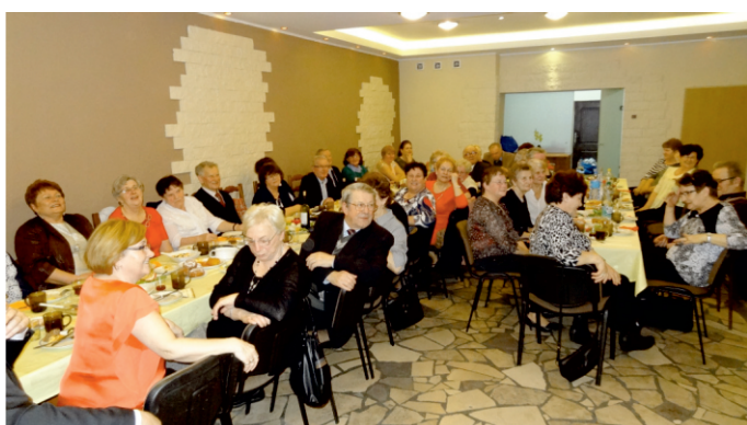
Dobra zabawa Klubu Seniora