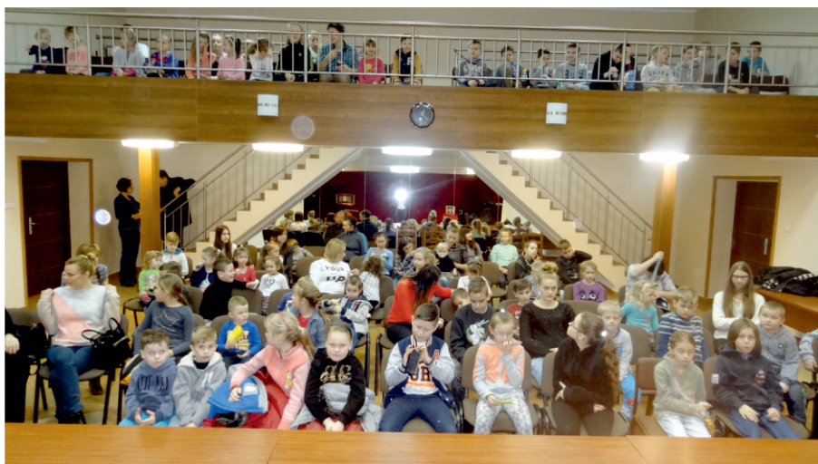
Uczestnicy ferii zimowych