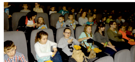
Alwin i Wiewiórki wielka wyprawa