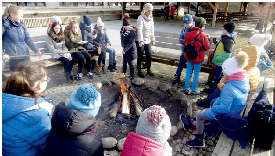
Nawet zimą można zjeść kielbasę z grilla