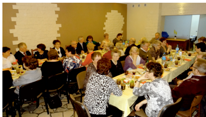
Śledzik Klubu Seniora w Liniewie