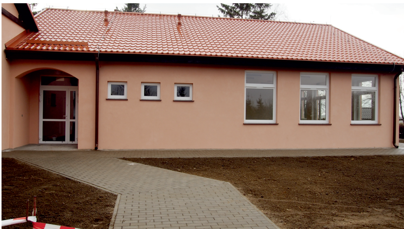
Kończymy prace przy rozbudowie przedszkola w Liniewie

Finalizujemy prace dotyczące rozbudowy przedszkola w Liniewie. Ostatnim etapem tego zadania jest wyposażenia nowej części obiektu w niezbędne meble. Już w niedługim czasie nastąpi dostawa nowych mebli do sal dydaktycznych przedszkola.