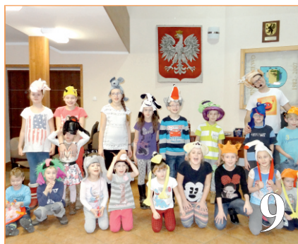
Ferie zimowe w GOKSiR w Liniewie