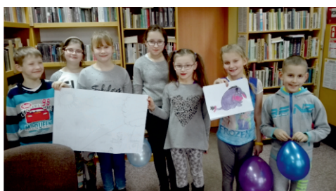
Lubimy Kubusia Puchatka