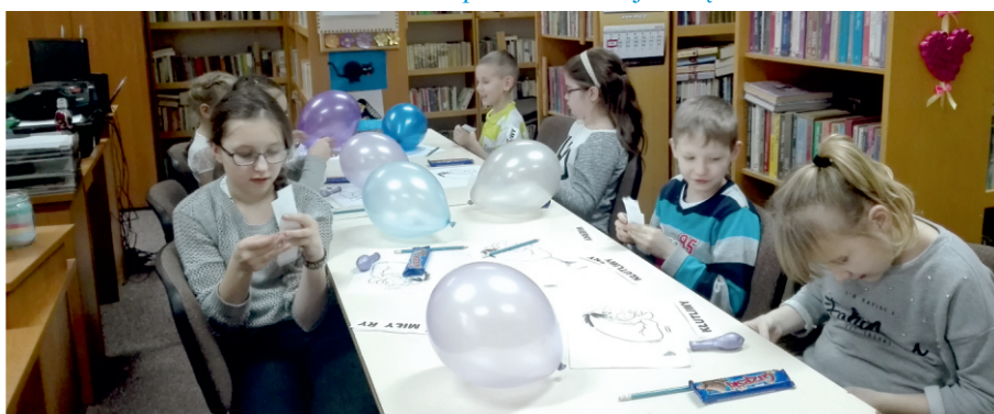
Zabawy w Bibliotece