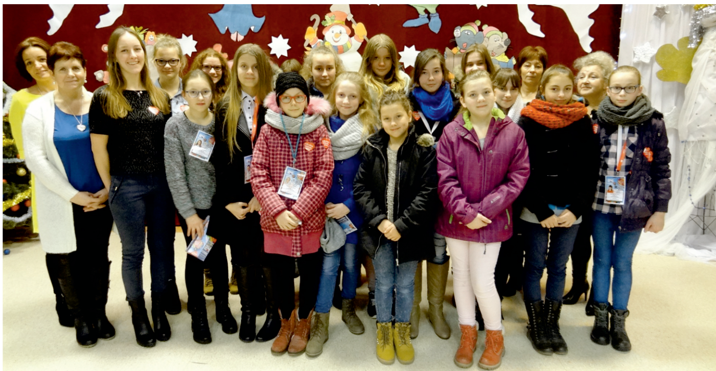
Wolontariusze WOŚP 2016

Serdecznie dziękujemy wszystkim osobom, które z dużym zaangażowaniem przyczyniły się do zbiórki pieniężnej i organizacji tegorocznego Finału WOŚP.