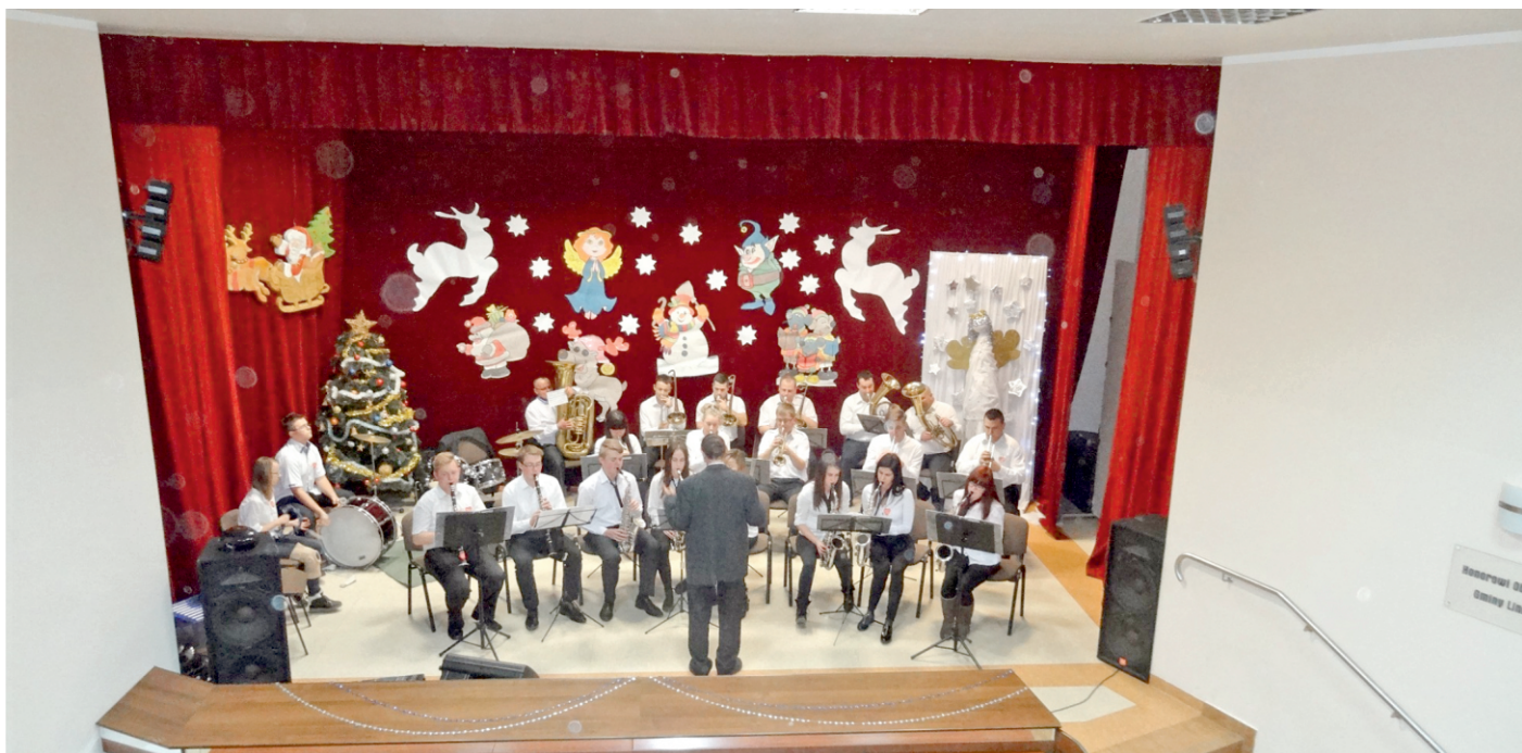
Orkiestra Dęta LinStarT