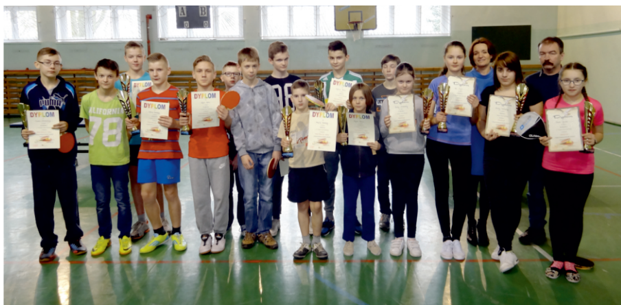
Turniej Tenisa Stołowego dla dzieci i młodzieży