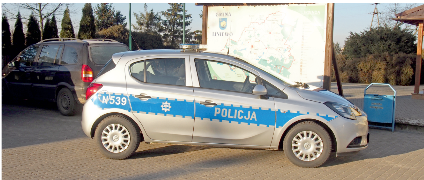
Nowy radiowóz dla liniewskiej Policji

Policjanci w Liniewie mają do dyspozycji nowy radiowóz - to opel corsa. Zakup pojazdu był możliwy dzięki współfinansowaniu gmin z terenu powiatu. Połowę środków wyłożyły Gminy: Liniewo, Nowa Karczma i Stara Kiszewa. Brakującą kwotę pokryła Komenda Główna Policji.