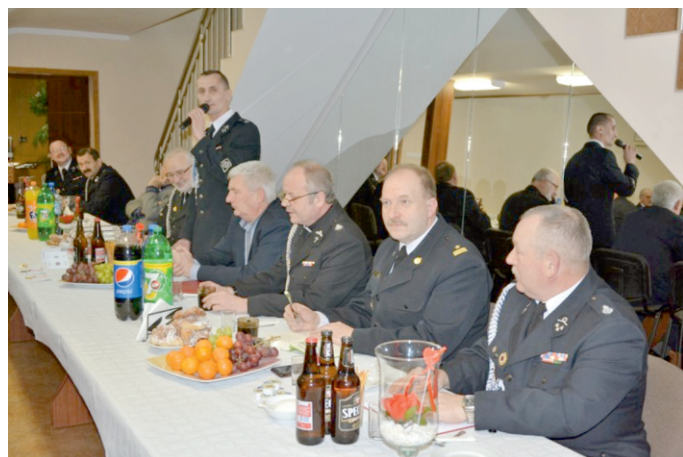
Wybory nowych władz OSP Liniewo