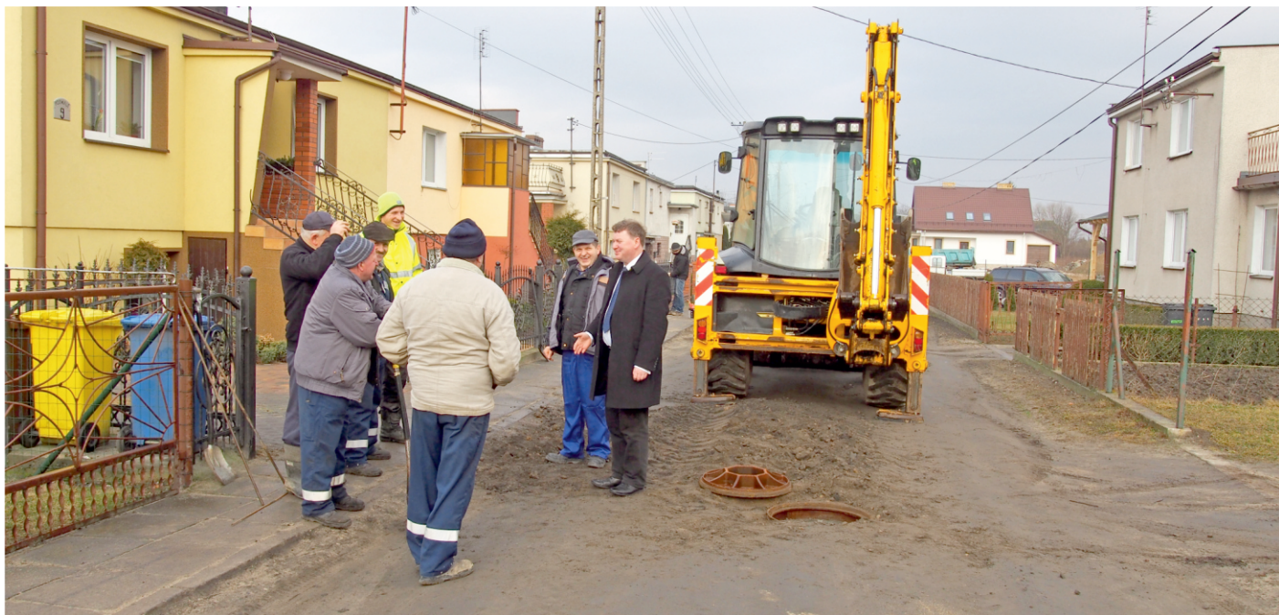
Początek prac drogowych na ul. Podwale w Liniewie

Ostatni odcinek ulicy Podwale otrzyma nową asfaltową nawierzchnię. Zostanie także położona nowa kanalizacja deszczowa na tym odcinku ulicy. Powstaną tu także nowe chodniki. Został już wyłoniony wykonawca, który do końca maja br. ma wykonać ten odcinek ulicy Podwale.