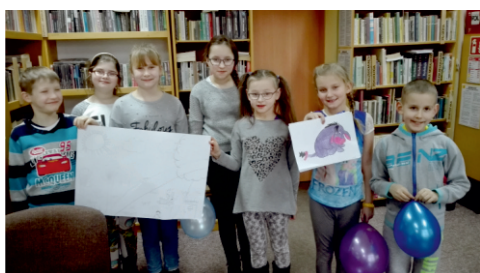
Lubimy Kubusia Puchatka