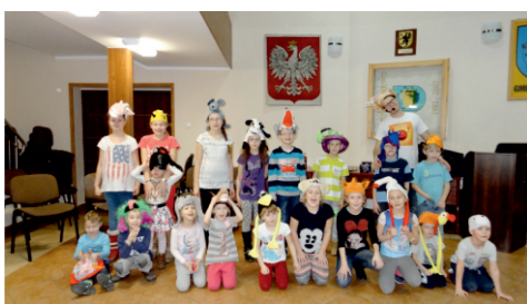
Nie ma czasu na nudę