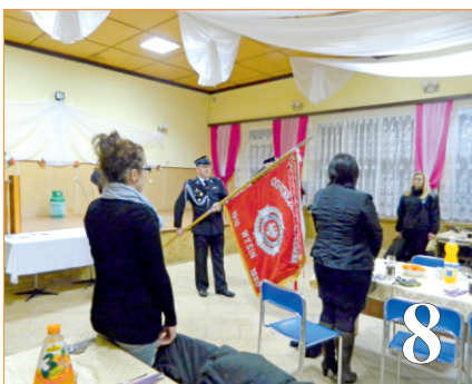
Wybory w jednostkach OSP